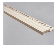
Blanc vintage - 161