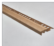
Marron vintage - 160