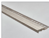
Gris vintage - 159