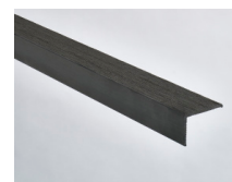
Nero - 165