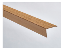
Cannella - 163