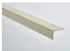
Cemento - 164